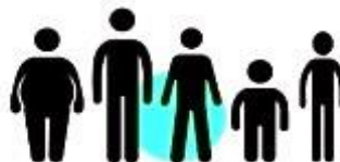
люди з нестандартними розмірами тіла: значно більшою або меншою за середню масою тіла, низького чи зависокого зросту