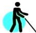
люди з постійними та/або тимчасовими функціональними порушеннями