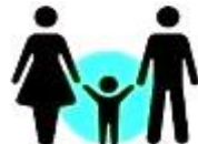
особи, які супроводжують малолітніх дітей